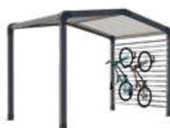
Range-vélos et/ou stockage