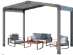
Espace de détente