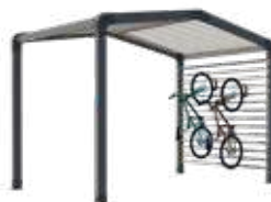
Range-vélos et/ou stockage