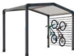
Range-vélos et/ou stockage