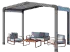
Espace de détente