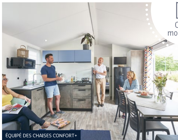
ÉQUIPÉ DES CHAISES CONFORT+