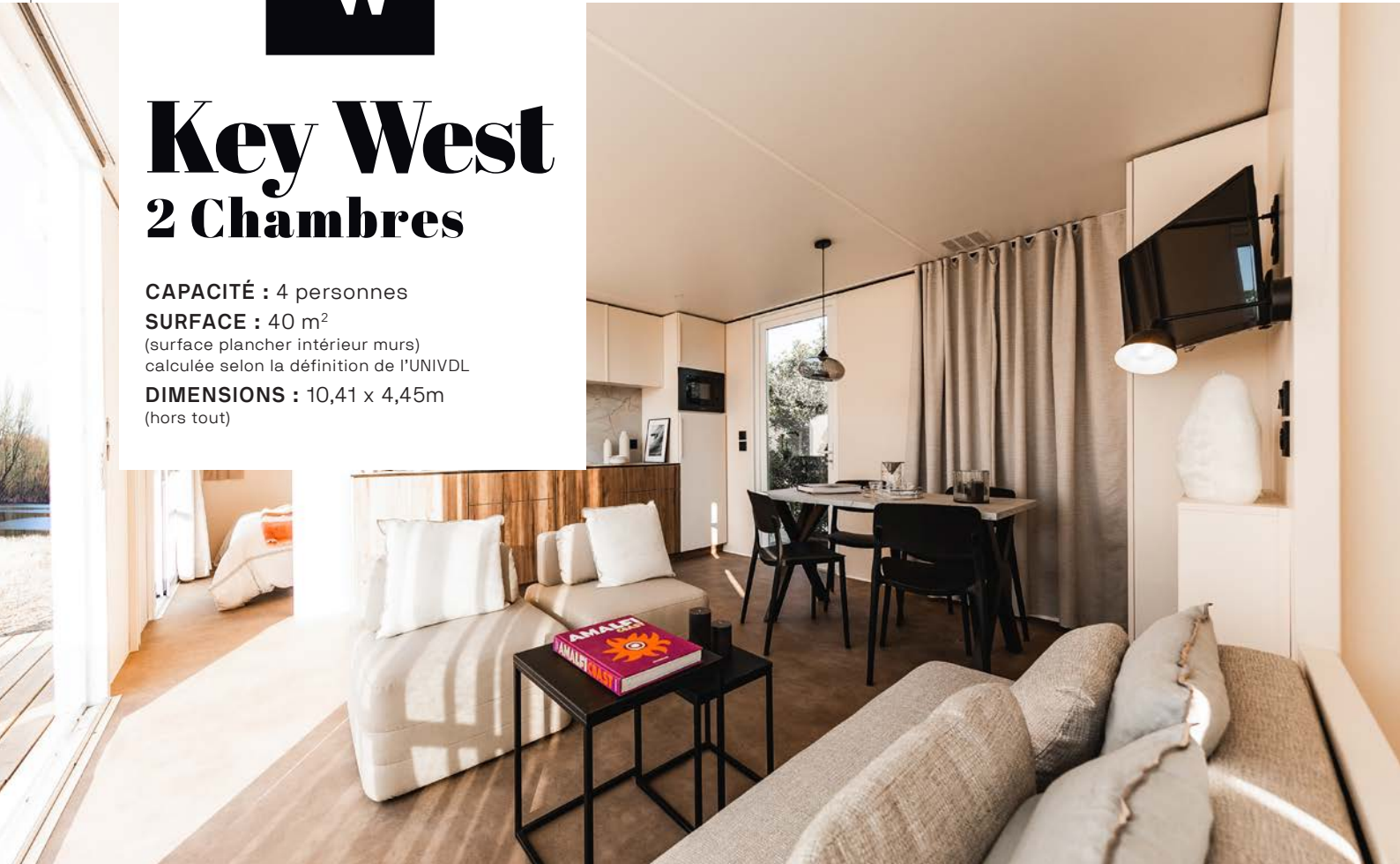
Cuisine présentée avec l'option micro-ondes intégré

Un écrin de luxe, particulièrement confortable avec ses deux suites parentales et enfants/invités, pour un standing inégalé en hôtellerie de plein air. La baie coulissante 3 vantaux de la façade arrière augmente instantanément l'habitat, invitant la nature et le soleil à entrer, à toute heure de la journée.